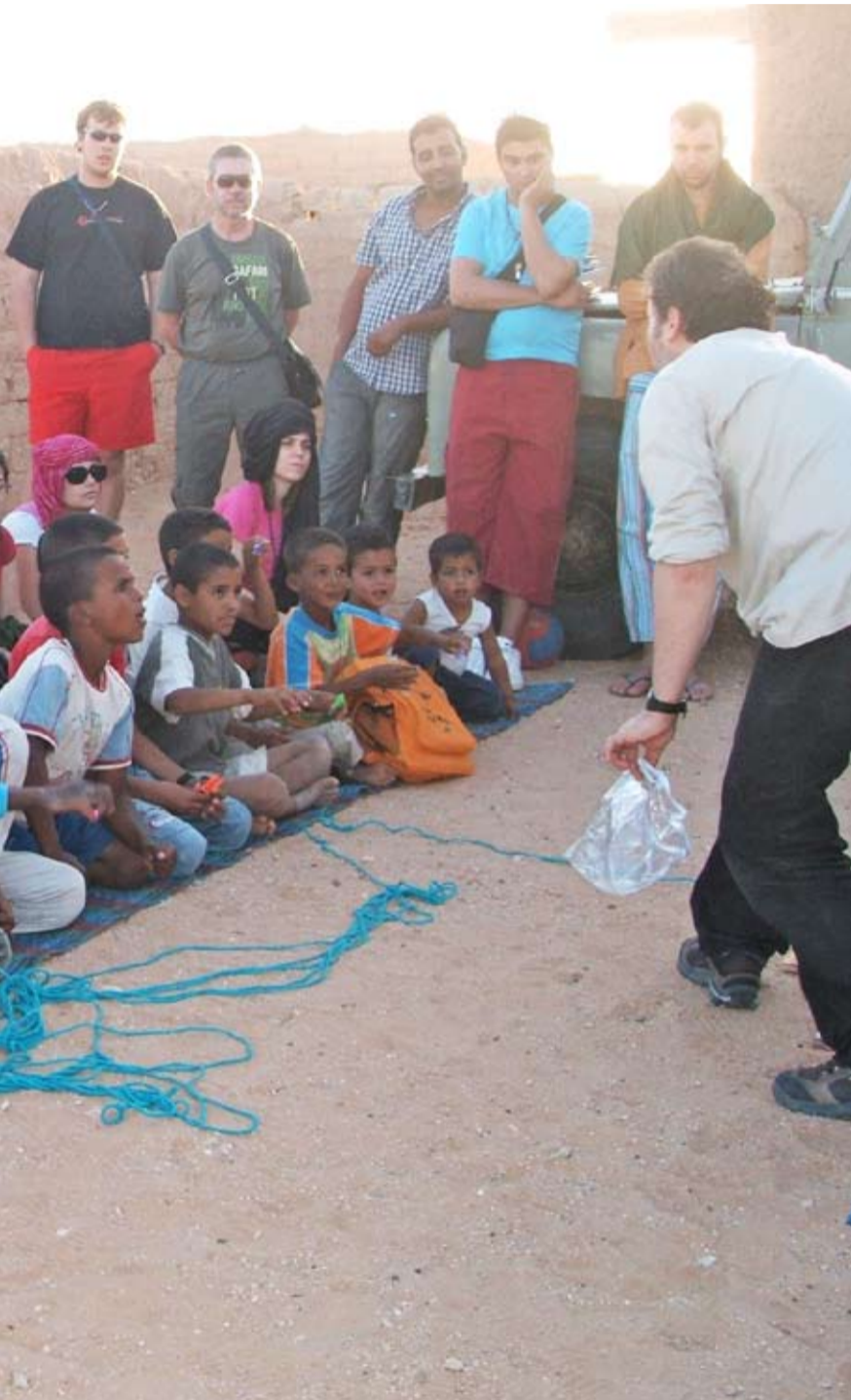
Niños saharauis escuchan un cuento narrado por un miembro en la iniciativa Bubisher, un bibliobús que viaja de pueblo en pueblo.