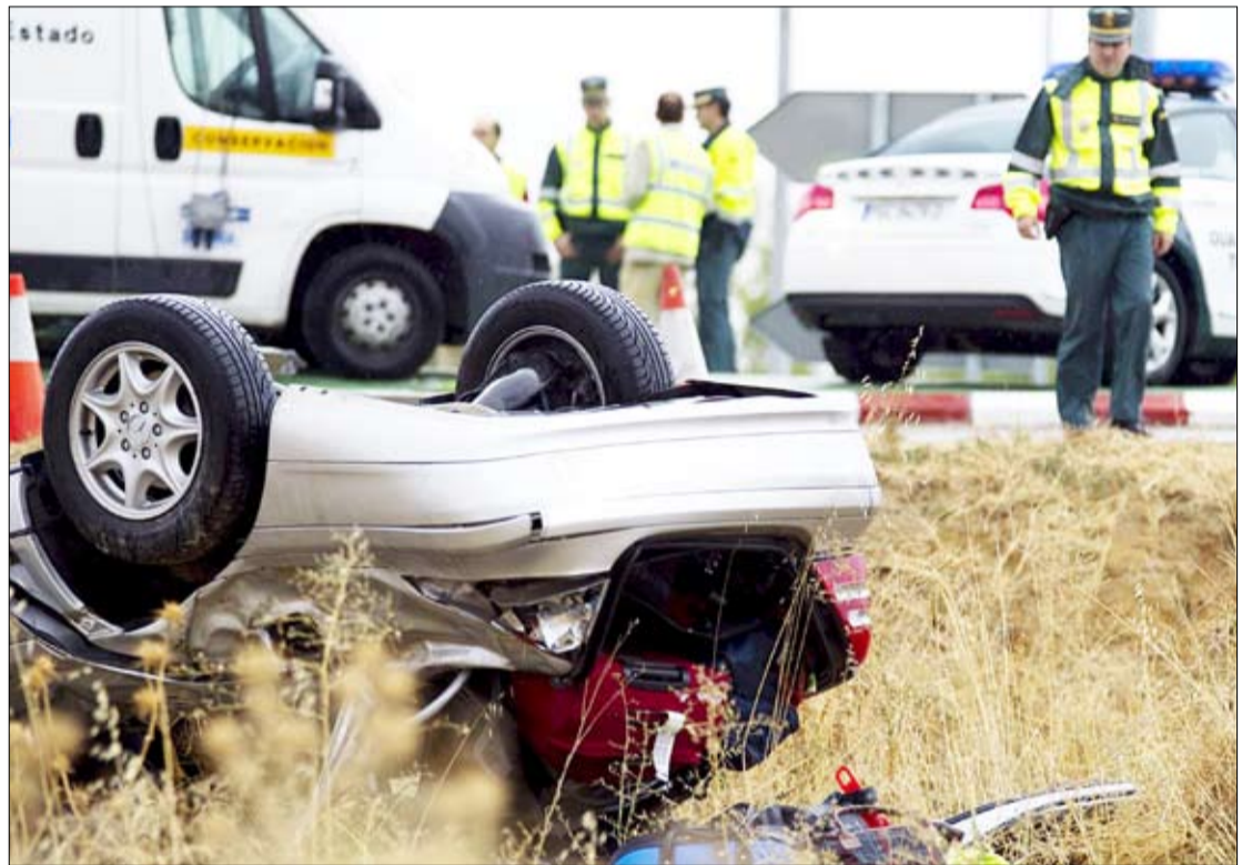
Varios agentes de la Guardia Civil prestan ayuda en un accidente con dos muertos y dos heridos ocurrido ayer en la localidad zamorana de Morales del Vino.

Rubalcaba reconoce que la llamada huelga de bolis caídos ha provocado una reducción del número de multas interpuestas por los agentes